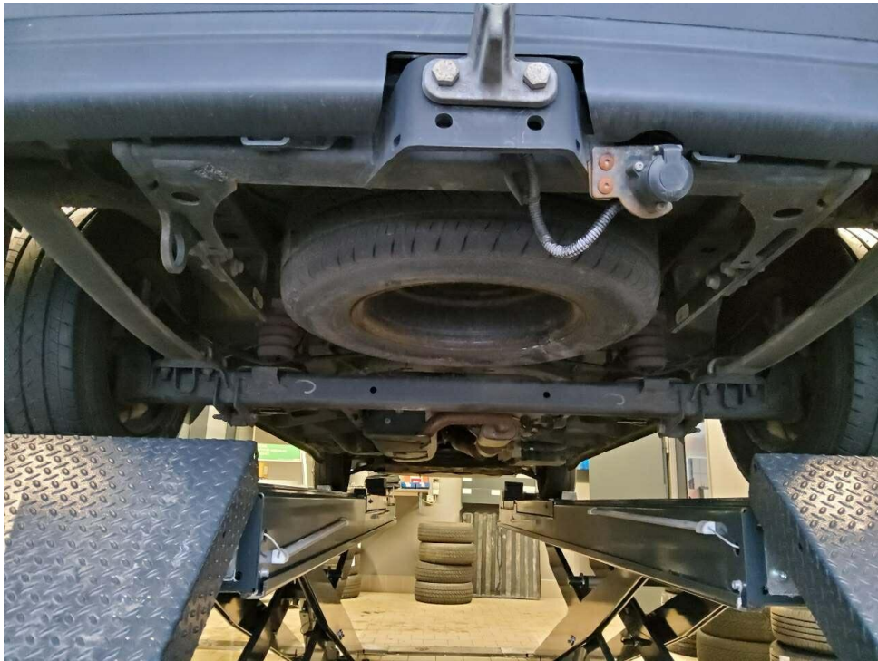
Bild 5 : Kugelkopf bei abnehmbarer Anhängerkupplung AHK (starr) am Fzg. verbaut